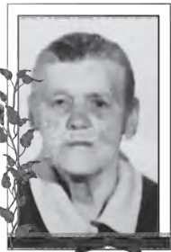
Дочь, зять, внуки.