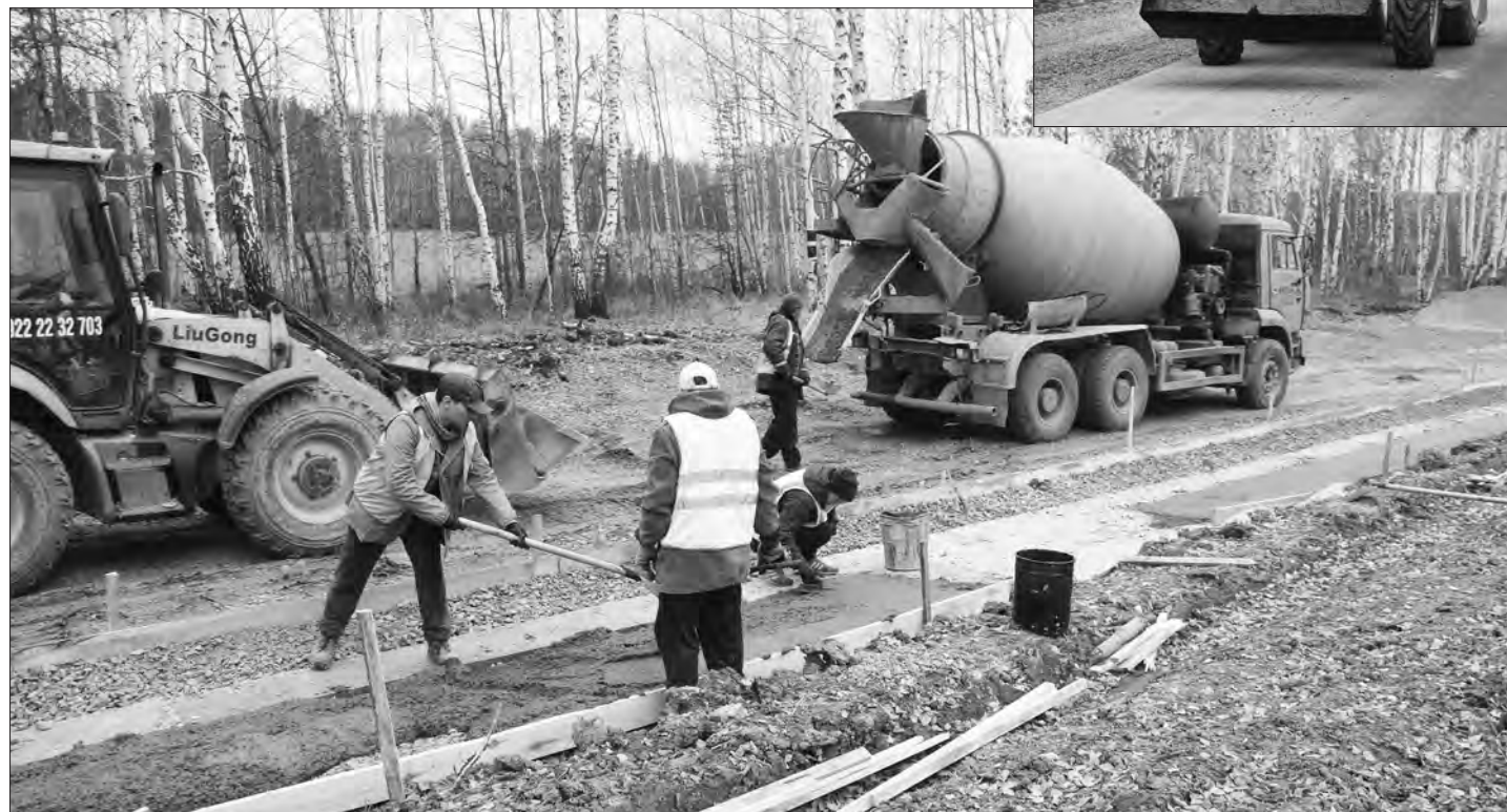
Бригада дорожных рабочих обустривает кюветы

ное новое, уложенное на качественное щебеночное основание, выполненное в соответствии со всеми требованиями, предусмотренными национальным проектом «Безопасные и качественные ав-