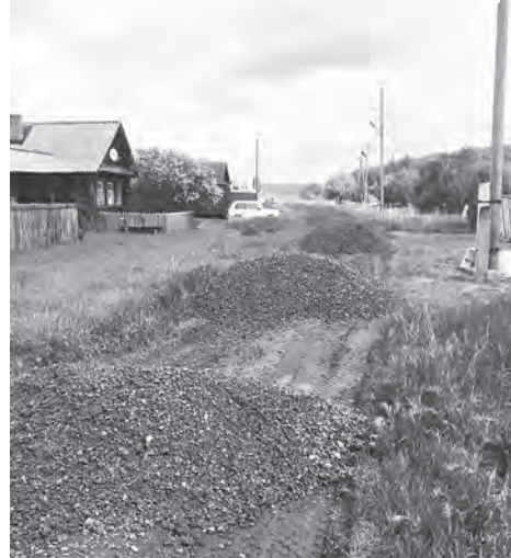
Грейдирование дорог в Шайдурихе

Е жегодно на территории Невьянского городского округа проводится ремонт не только городских, но и сельских дорог. Как правило, на селе ведется отсыпка и грейдирование. В летний период 2020 года такому ремонту подверглось более 19 км сельских дорог.