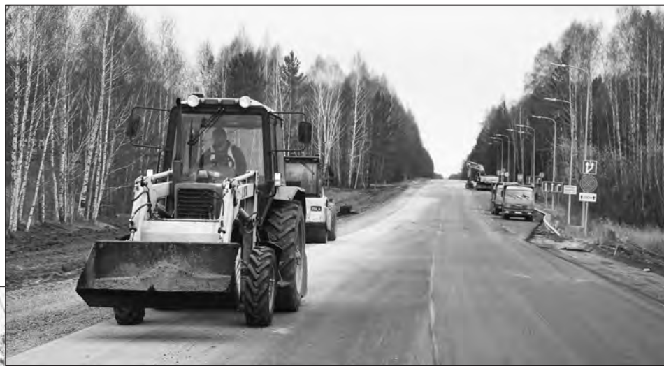
На отремонтированных участках дороги вскоре появятся дорожные знаки

томобильные дороги». В конечном итоге этот участок трассы стал выше прежнего почти на полметра и, что гораздо важнее, безопаснее: при проведении ремонтных работ были использованы современные и исключительно качественные материалы, препятствующие образованию колеи и увеличивающие срок службы дорожного полотна.