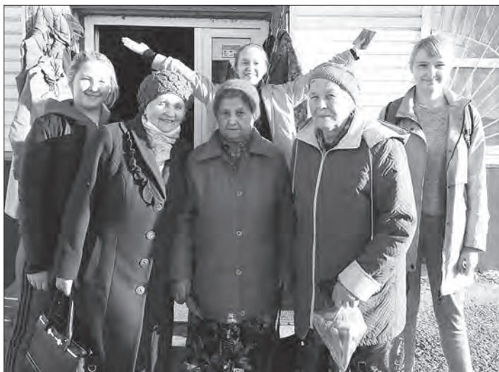
Благодарные зрители концерта и довольные артисты