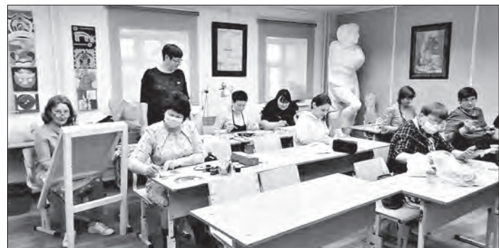
Искусству все возрасты покорны

Е.МЕДОВЩИКОВА, преподаватель НДХШ