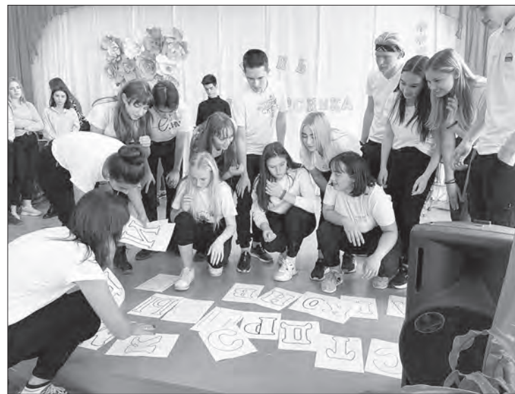
За штурм берется команда первокурсников

7 октября в Уральском горнозаводском колледже имени Демидовых состоялся очередной День первокурсника. Учебное заведение приветствовало 185 первокурсников 2020 года.