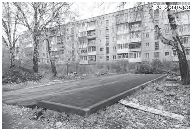
Основание под контейнеры готово