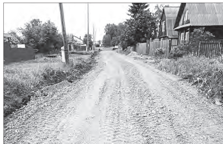
Ремонт в Середовине