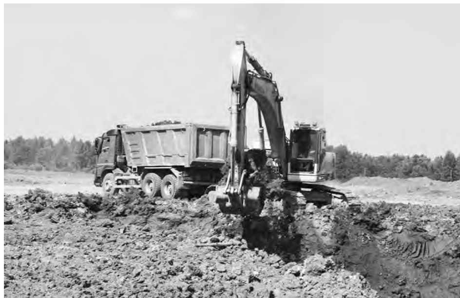
Вскрышные работы на гидравлике «Нейвинская»