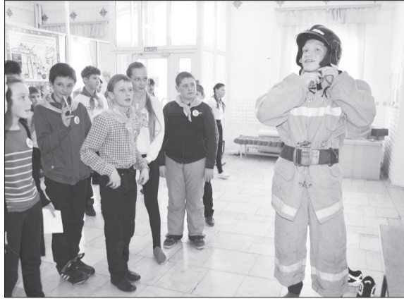
В пожарной боевке юный дружинник команды села Аятского