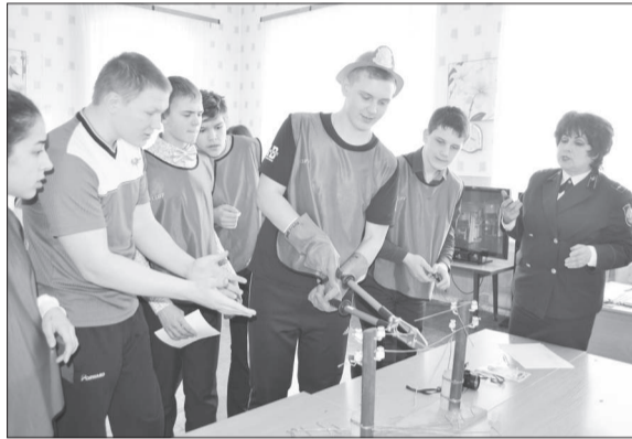
ДЮП пос.Ребристого на новой станции слета «Электрической»