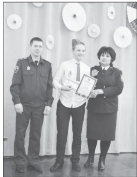
И вновь с победой «Прометей»