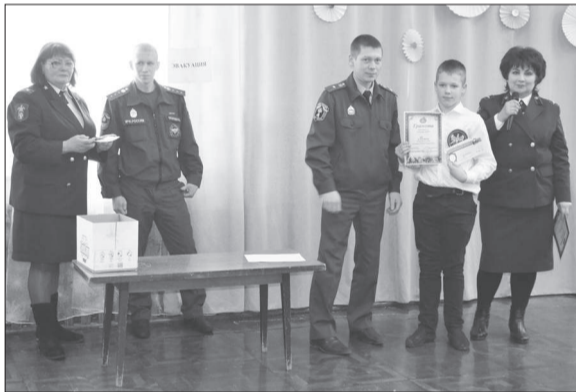
Призовое второе место у школы №5