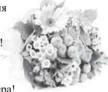
Совет ветеранов МО МВД России «Невьянский».

Хотим вас поздравить с днем рождения И очень много счастья пожелать! Пускай отличным станет настроение, Пусть будет все, о чем можно мечтать! От радости глаза пускай искрятся, Желаем света, солнца и добра, Как можно чаще ярко улыбаться, Чтоб стала жизнь прекрасней, чем вчера!