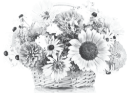
С любовью, твои дети, внуки, правнучка.

Дорогая бабушка и мама, С юбилеем поздравляем мы, Пусть без слез, горя и обмана Будут будущие твои дни. Пусть улыбка остается доброй, От нее на сердце так легко, Пусть от радости и счастья бодро Светится теплом твое лицо. Пускай рядом будут все родные, С кем связали чувства или кровь. Пусть сбываются мечты любые И всегда в душе царит любовь.